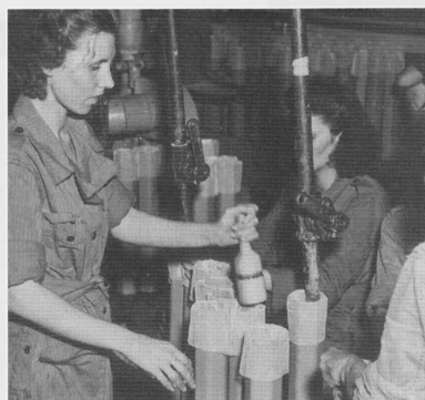
アメリカにおける M69 焼夷弾の生産