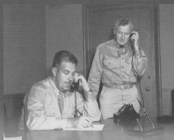
原爆開発を指揮したグローヴズ (左) と副官ファレル (右)