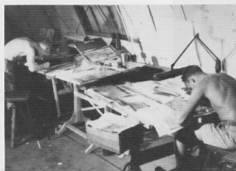
写真偵察機が撮影した写真を判読し分析する作業