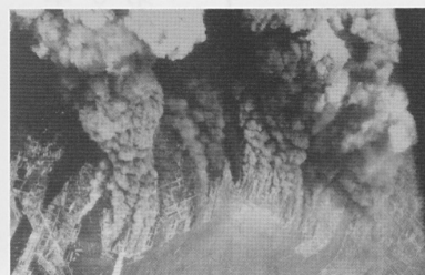
6月1日白昼の大阪市街地空襲