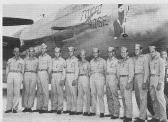
B-29を改造した写真偵察機 F-13 と東京を偵察した第 3 写真偵察戦隊の隊員